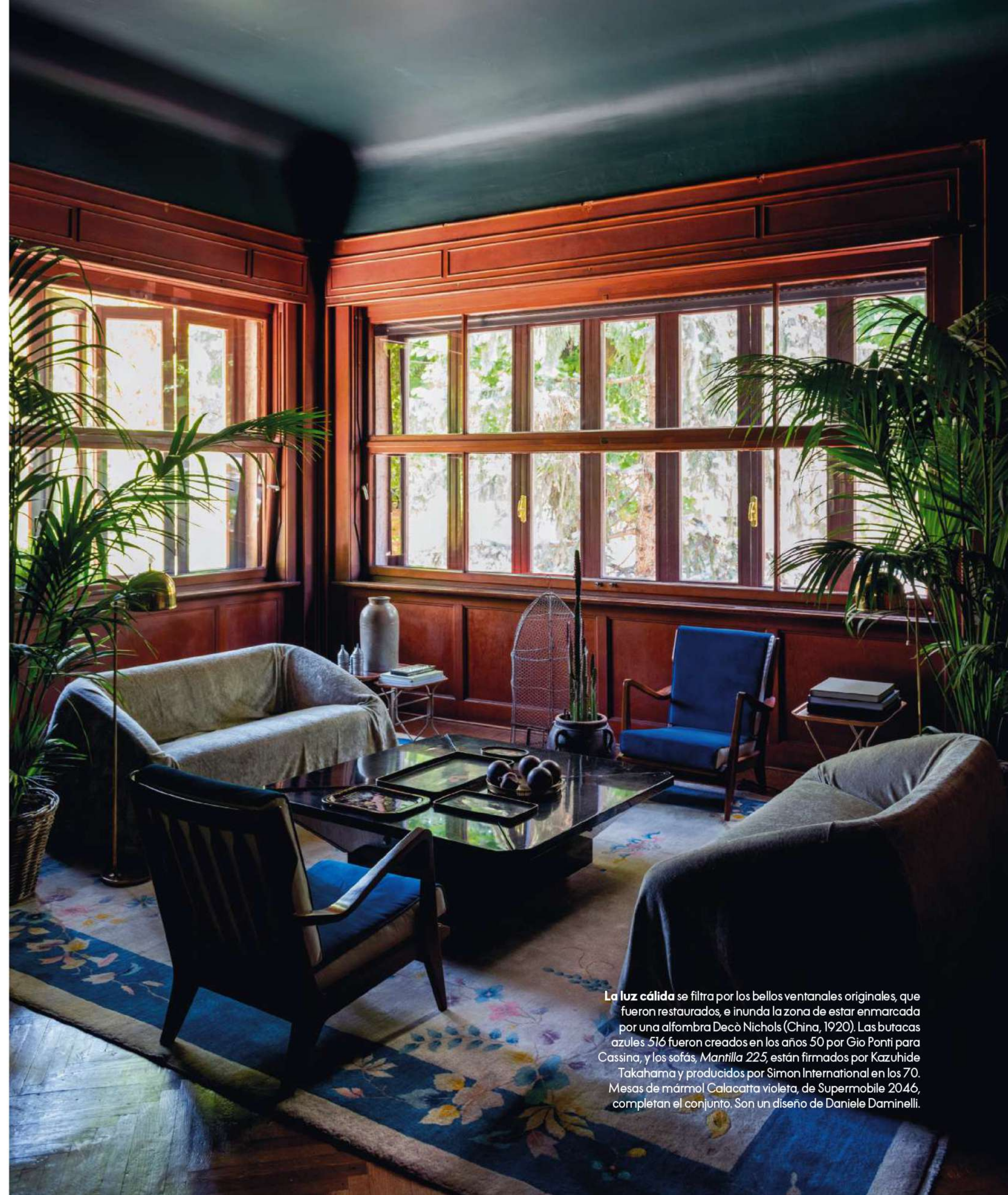
La luz cálida se filtra por los bellos ventanales originales, que fueron restaurados, e inunda la zona de estar enmarcada por una alfombra Decò Nichols (China, 1920). Las butacas azules 516 fueron creados en los años 50 por Gio Ponti para Cassina, y los sofás, Mantilla 225 , están firmados por Kazuhide Takahama y producidos por Simon International en los 70. Mesas de mármol Calacatta violeta , de Supermobile 2046, completan el conjunto. Son un diseño de Daniele Daminelli.