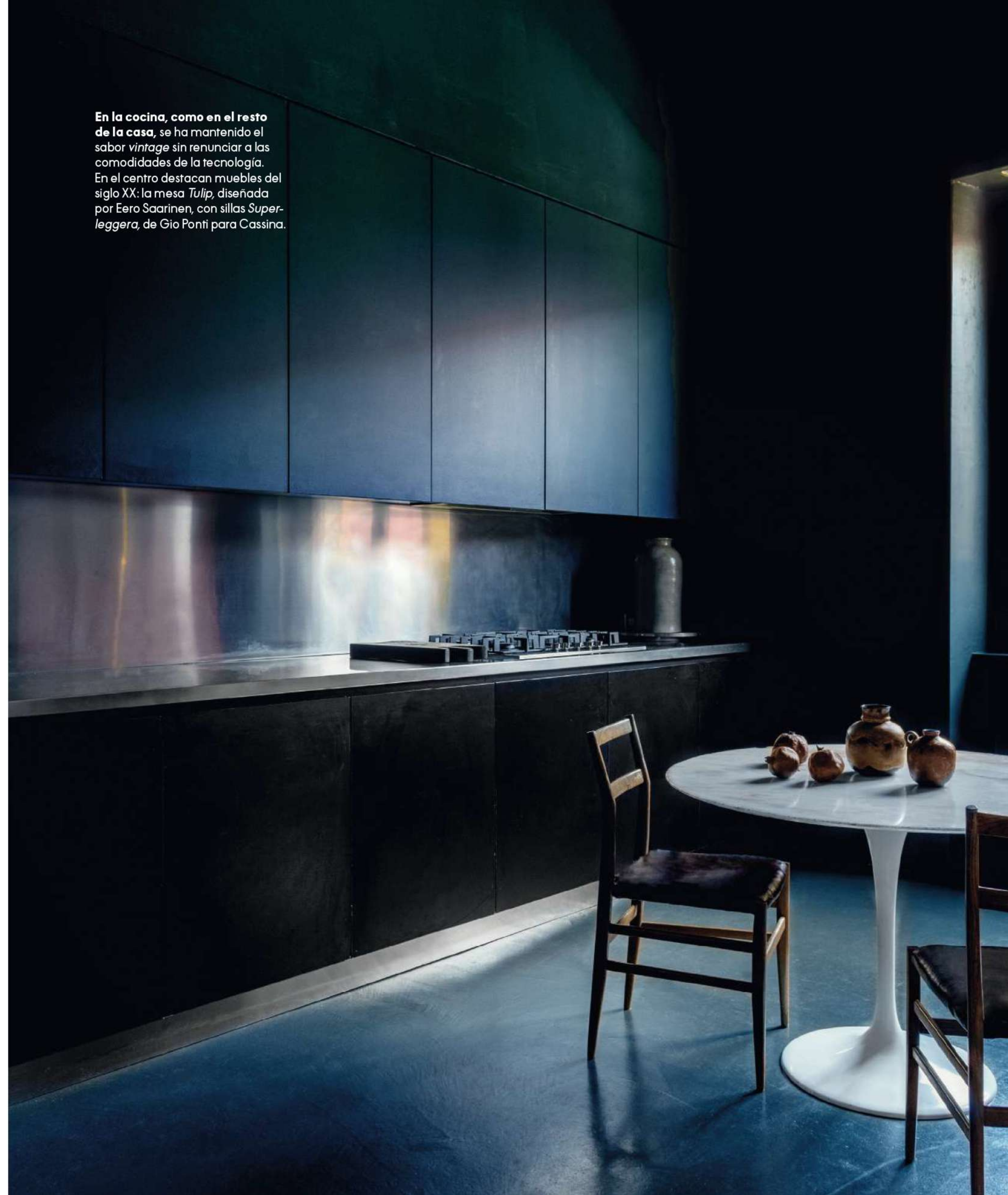
En la cocina, como en el resto de la casa, se ha mantenido el sabor vintage sin renunciar a las comodidades de la tecnología. En el centro destacan muebles del siglo XX: la mesa Tulip , diseñada por Eero Saarinen, con sillas Super- leggera , de Gio Ponti para Cassina.