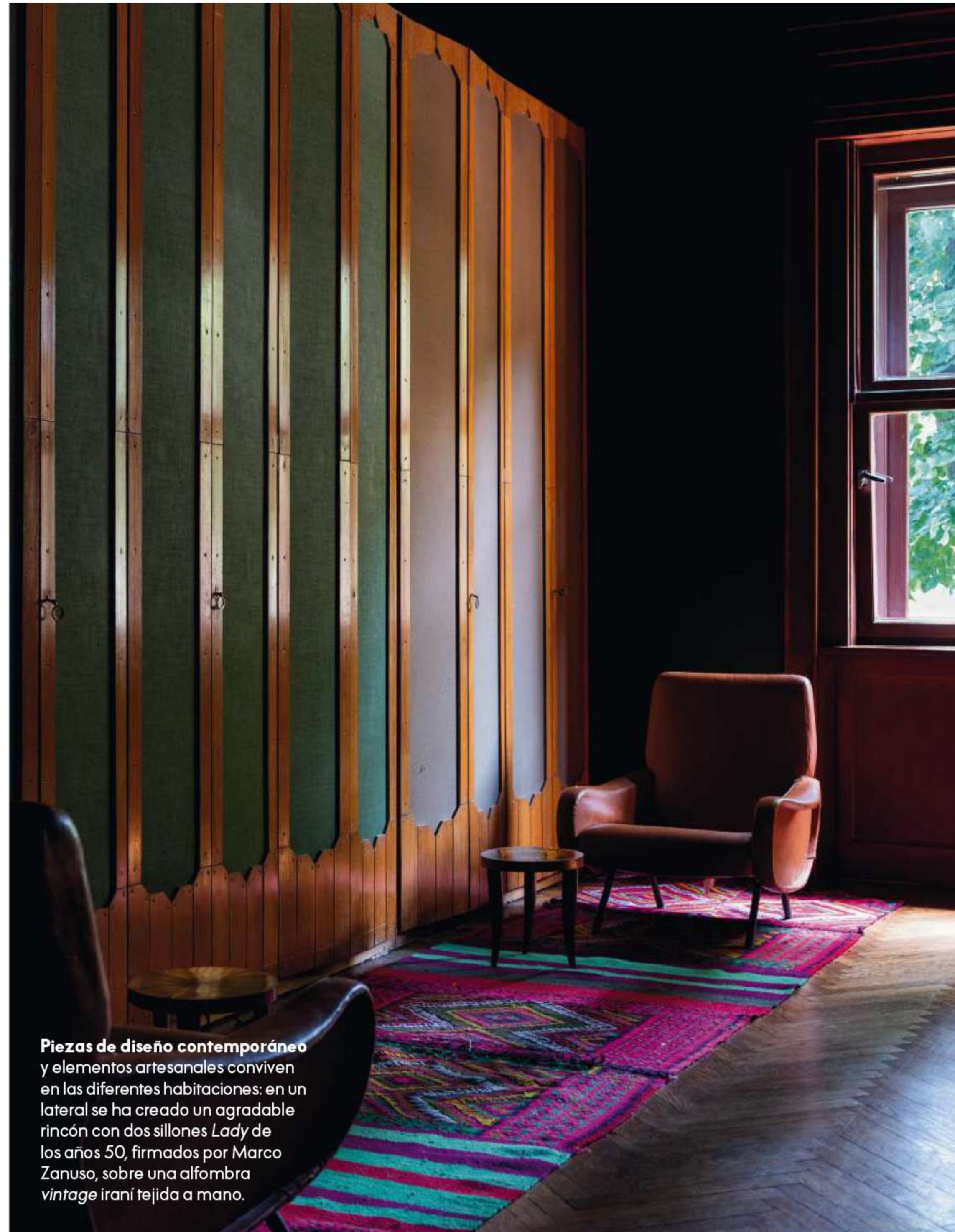
Piezas de diseño contemporáneo y elementos artesanales conviven en las diferentes habitaciones: en un lateral se ha creado un agradable rincón con dos sillones Lady de los años 50, firmados por Marco Zanuso, sobre una alfombra vintage iraní tejida a mano.