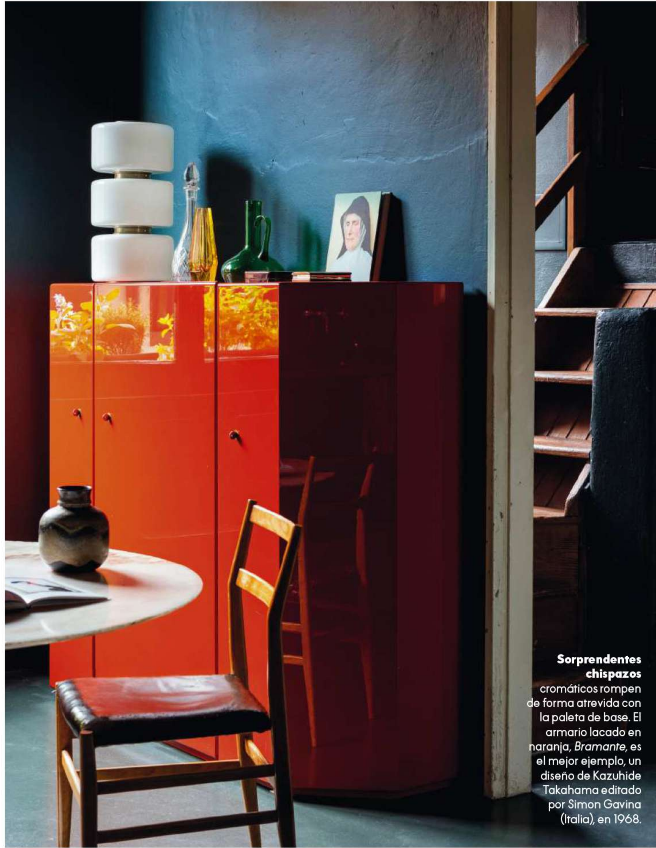
Sorprendentes chispazos cromáticos rompen de forma atrevida con la paleta de base. El armario lacado en naranja, Bramante , es el mejor ejemplo, un diseño de Kazuhide Takahama editado por Simon Gavina (Italia), en 1968.